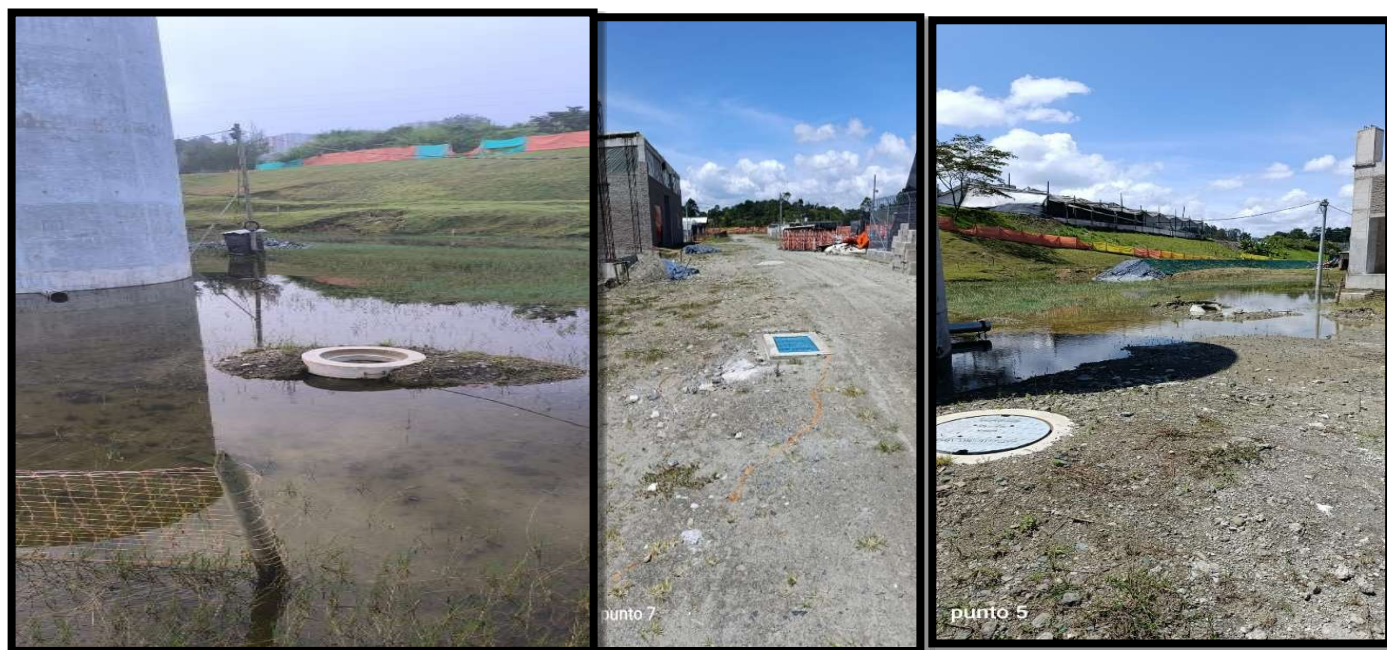
Figura. 1 Nota. Registro fotográfico del 9 de noviembre de 2025, en condiciones sin lluvias de la PTAR Tranvía.

EPM adjuntó el registro fotográfico mostrado en la visita del 10 de noviembre de 2025 por parte de la Contraloría Distrital de Medellín tomado el día anterior, en condiciones sin lluvias, donde se observa el terreno seco como resultado de las labores de mantenimiento implementadas.